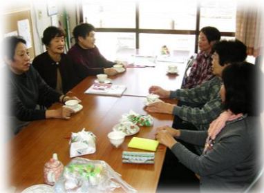
なでしこ会 第3月曜日 10:00～ 長洲中通1丁目