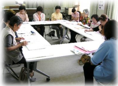
ふくろう 第2木曜日 10:00～ 長洲本通1丁目