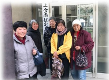
魚取団地茶話会 (うおとりだんちさわかい) 毎月1回月曜日 13:00～ 食満1丁目