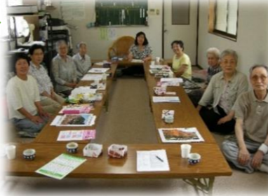
お元気会(おげんきかい) 第3水曜日 10:00～ 長洲中通2丁目

「出あい・ふれあい・支えあい」、 3つの「愛」をはぐくむ、それが地域グループです