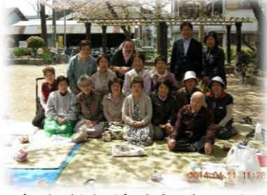
お金楽会(おきらくかい) 第2金曜日 10:00～ 金楽寺町2丁目